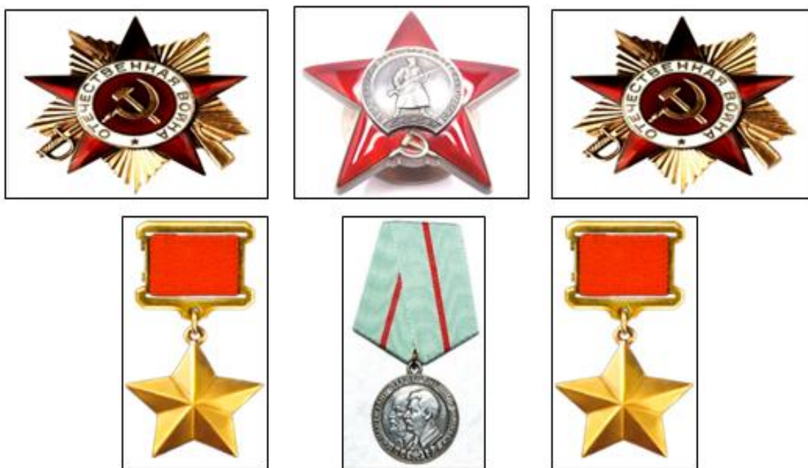
Фото 4. Дидактический материал к заданию «Логическая цепочка»