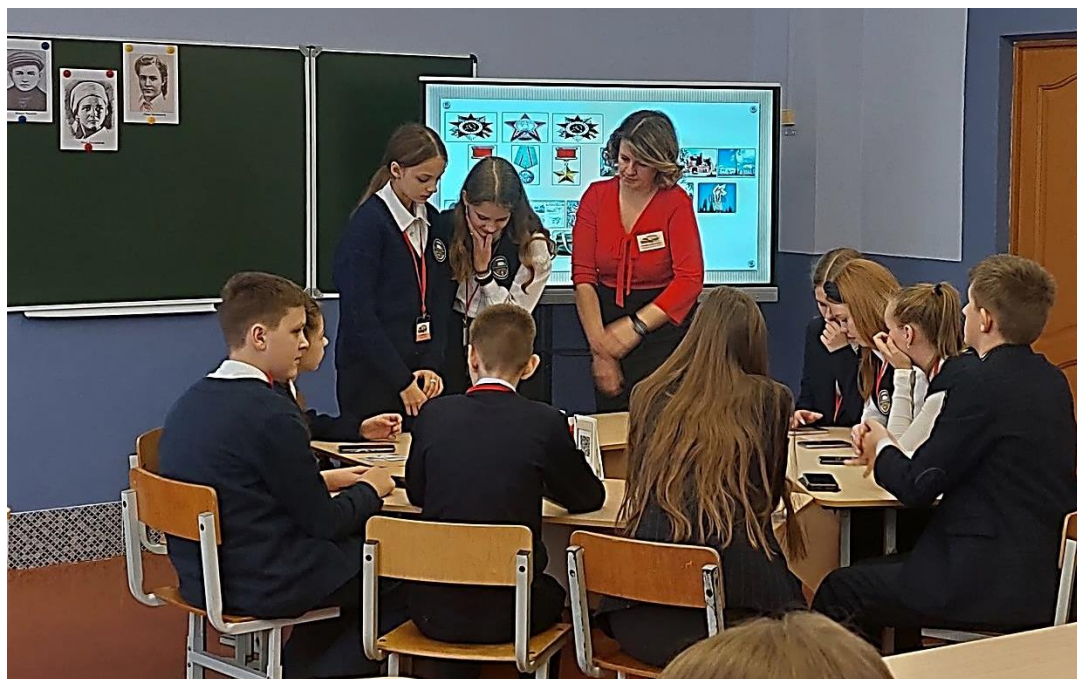
Фото 6. Во время проведения музейного урока

Ведущий 1. Всё помнится, ничто не позабыто, Всё помнится, никто не позабыт. И днём, и ночью в чаше из гранита Святое пламя трепетно горит.