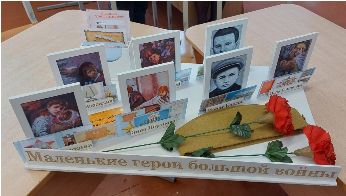
Фото 2. Дидактический материал «Маленькие герои большой войны»