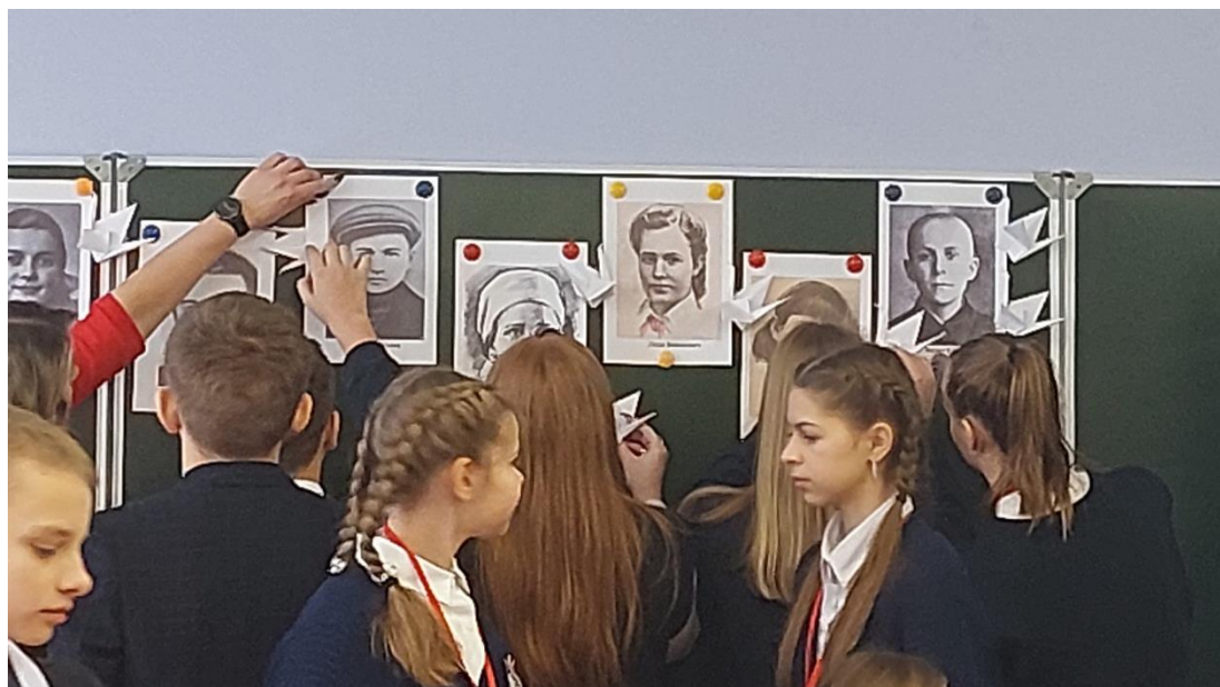
Фото 7. Заключительный этап музейного урока

Педагог. Мы помним прошлое и уверены, что мирное будущее нашей страны – в надежных руках молодого поколения! Спасибо большое всем за работу!