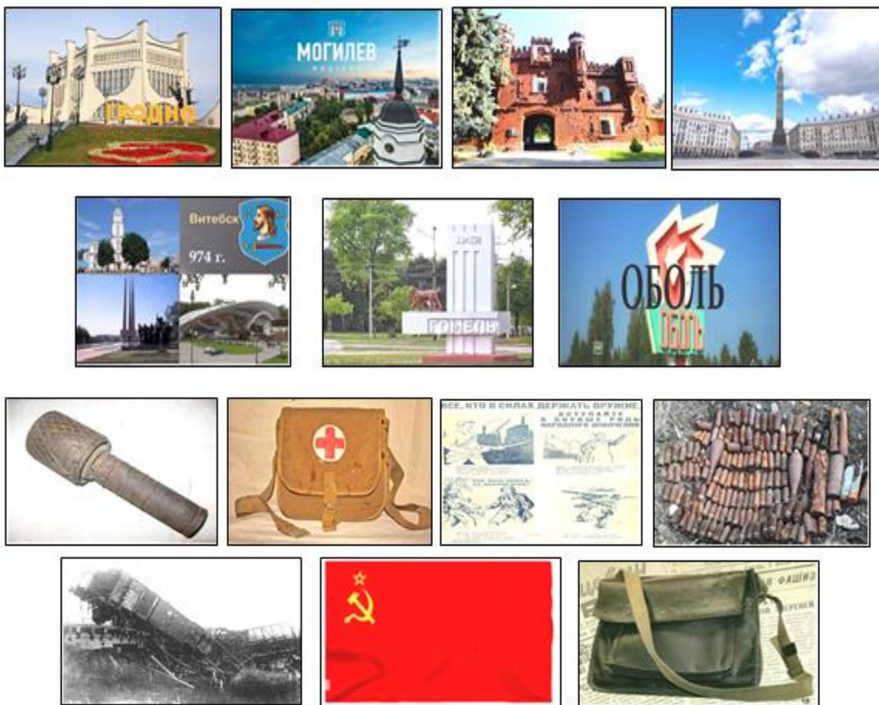
Фото 5. Дидактический материал к заданию «Логическая цепочка»