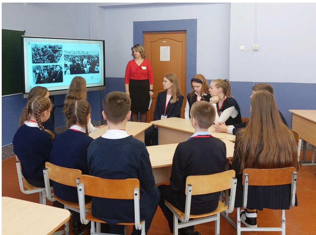
Фото 1. Участники музейного урока