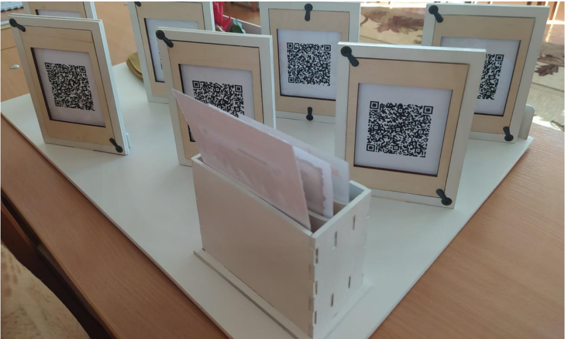
Фото 3. Дидактический материал «Маленькие герои большой войны»